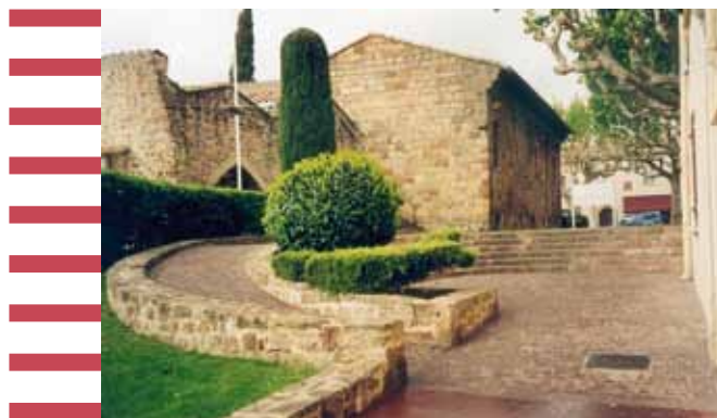
Exemple d'une intégration architecturale réussie d'une rampe d'accès dans un environnement préservé.

commun, volonté de créer des zones de rencontre ou de réduire la circulation automobile, demandes d'association, etc.).