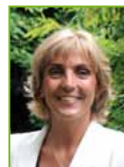
Valérie Létard, secrétaire d'État auprès de Jean-Louis Borloo, ministre d'État

Madame, Monsieur le Maire, c'est ensemble que nous pourrons peu à peu réussir le grand chantier de l'accessibilité.