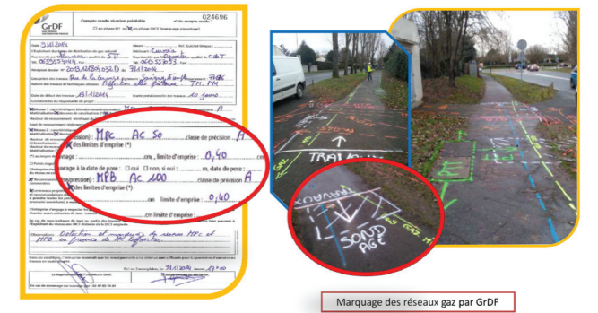
Marquage des réseaux gaz par GrDF

entre les deux parties (GrDF et EUROVIA). Les paragraphes du Guide Technique de travaux ont été commentés à son équipe.