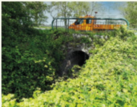
La dévégétalisation est une opération d'entretien courant qui permet de prévenir la dégradation des ouvrages

L'entretien courant est une opération d'entretien préventive qui consiste à intervenir tous les ans, avant que l'ouvrage ne soit altéré. Les interventions d'entretien courant sont généralement des actions simples, pouvant être réalisées en régie : nettoyage de l'ouvrage, maintien opérationnel des dispositifs d'assainissement, dévégétalisation... Il permet de prévenir la dégradation rapide des ouvrages, évitant ainsi à moindre frais des réparations ultérieures coûteuses. L'entretien courant est utile pour préparer les actions de surveillance afin d'avoir une meilleure visibilité de l'ouvrage.