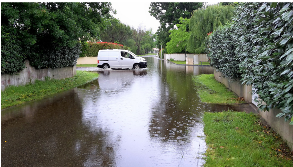
Rue inondée

Il faut également tenir compte des conditions nouvelles et de l'obligation qu'a la victime de rapporter que le dommage dont elle se plaint est bien lié aux travaux. Ce qui n'est pas le cas si elle ne parvient pas à démontrer que « dans la période postérieure à l'acquisition de sa propriété, le ravinement dont se plaint M. B... se serait aggravé du fait de l'état des lieux existant ou aurait été provoqué par un nouvel aménagement de l'ouvrage ni que ce ravinement excéderait les inconvénients normaux auxquels sont exposés les riverains de fossés d'écoulement des eaux qui doivent supporter l'écoulement naturel des fonds supérieurs canalisés par un ouvrage public » (même arrêt).