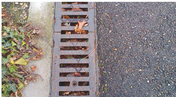
Caniveau avec grille

Ce qu'il ne faut pas confondre avec les prestations relatives à la fourniture et à l'évacuation de l'eau effectuées dans le cadre de la gestion du service public de l'eau : les opérations de balayage des caniveaux, quelle que soit leur incidence sur l'écoulement des eaux de ruissellement, ne sont pas réalisées à l'occasion de l'entretien des égouts mais dans le cadre des prestations contractuelles d'entretien courant de la voirie communale et, de ce fait, ne peuvent être regardées comme effectuées ni par un exploitant ou un mandataire du service de l'eau et de l'assainissement, ni par un co-contractant de l'exploitant du service, quand bien même ce