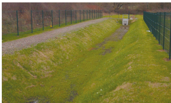
Bassin de rétention

Il n'est cependant nécessaire qu'une délimitation formelle existe pour que la question des eaux pluviales soit prise en compte. L'article L.752-6 du code de commerce précise en effet qu'au titre des critères qui fondent son avis en matière d'urbanisme commercial, la commission départementale d'aménagement commercial prend notamment en considération en matière de développement durable, la qualité environnementale du projet, qui intègre la gestion des eaux pluviales et l'imperméabilisation des sols. La prise en compte de ce critère par le porteur du projet ne suffit cependant pas à lui seul à compenser les insuffisances constatées par ailleurs (en l'occurrence, la faiblesse de la desserte par une ligne de transport en commun) ( CAA Nantes, 26 oct. 2016, SAS Sympadis, req. n°15NT01366 ). En revanche, respecte ces contraintes le projet qui accorde une large place aux espaces verts et prévoit la réalisation de surfaces de stationnement perméables, à hauteur de 14 % de la superficie totale du terrain d'assiette et qui prévoit « que les eaux pluviales soient traitées "à la parcelle", par la réalisation de noues d'infiltration plantées de haies vives et de différents aménagements destinés à éviter les ruissellements et à permettre le rejet des eaux vers des points d'infiltration et de rétention adaptés » ( CAA Douai, 13 juill. 2017, SAS supermarchés Match, req. n° 16DA01462 ).