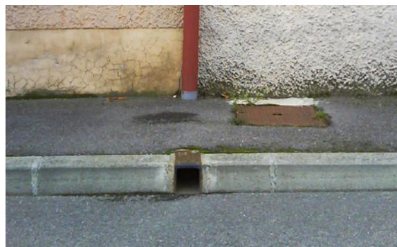
Descente de toiture et gargouille

« Seules sont susceptibles d'être déversées dans le réseau pluvial : les eaux pluviales, les eaux de pompes à chaleur, les eaux de refroidissement à une température inférieure à 30°C, certaines eaux résiduaires industrielles prétraitées ou non mais dont la qualité est telle qu'il est inutile de les diriger vers un ouvrage d'épuration (cette catégorie de rejet sera définie dans la convention entre l'établissement industriel et la commune) » (Le Chesnay, règlement du service d'assainissement, art. 4).